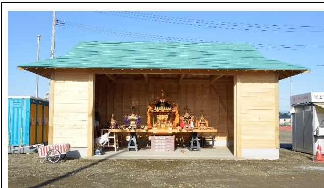
正面は引き戸として左右に開きます。